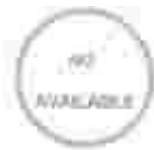
Инструкция по эксплуатации